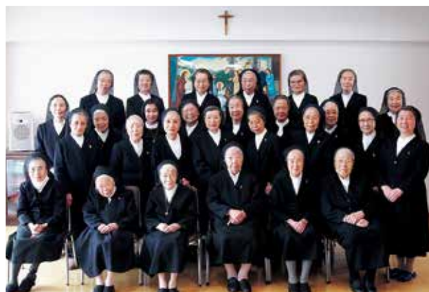
2015年11月23日 日本地区の集まりにて

「私たちの毎日は祈りです。卒業生のため、学校で働いている人、生徒・児童・園児、世界のために祈っています。生涯、ミッションです」。