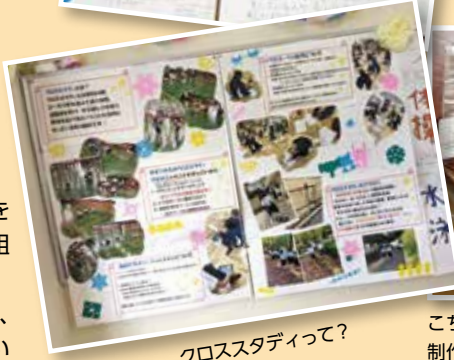
クロススタディって?