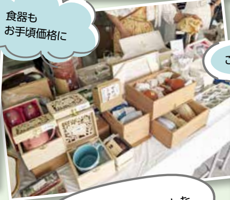
こんな高級品も格安で