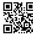
同窓会ホームページ