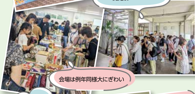
会場は例年同様大にぎわい